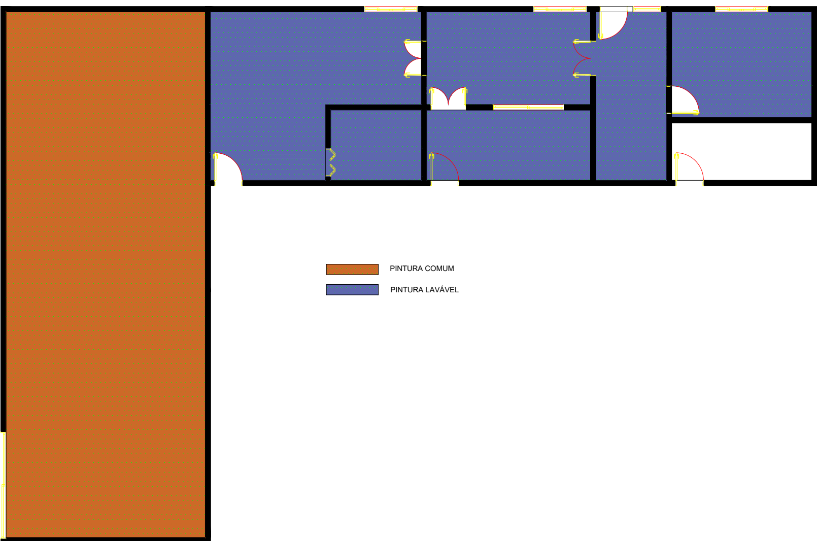
Planta Baixa - Pintura Esc.: 1/100