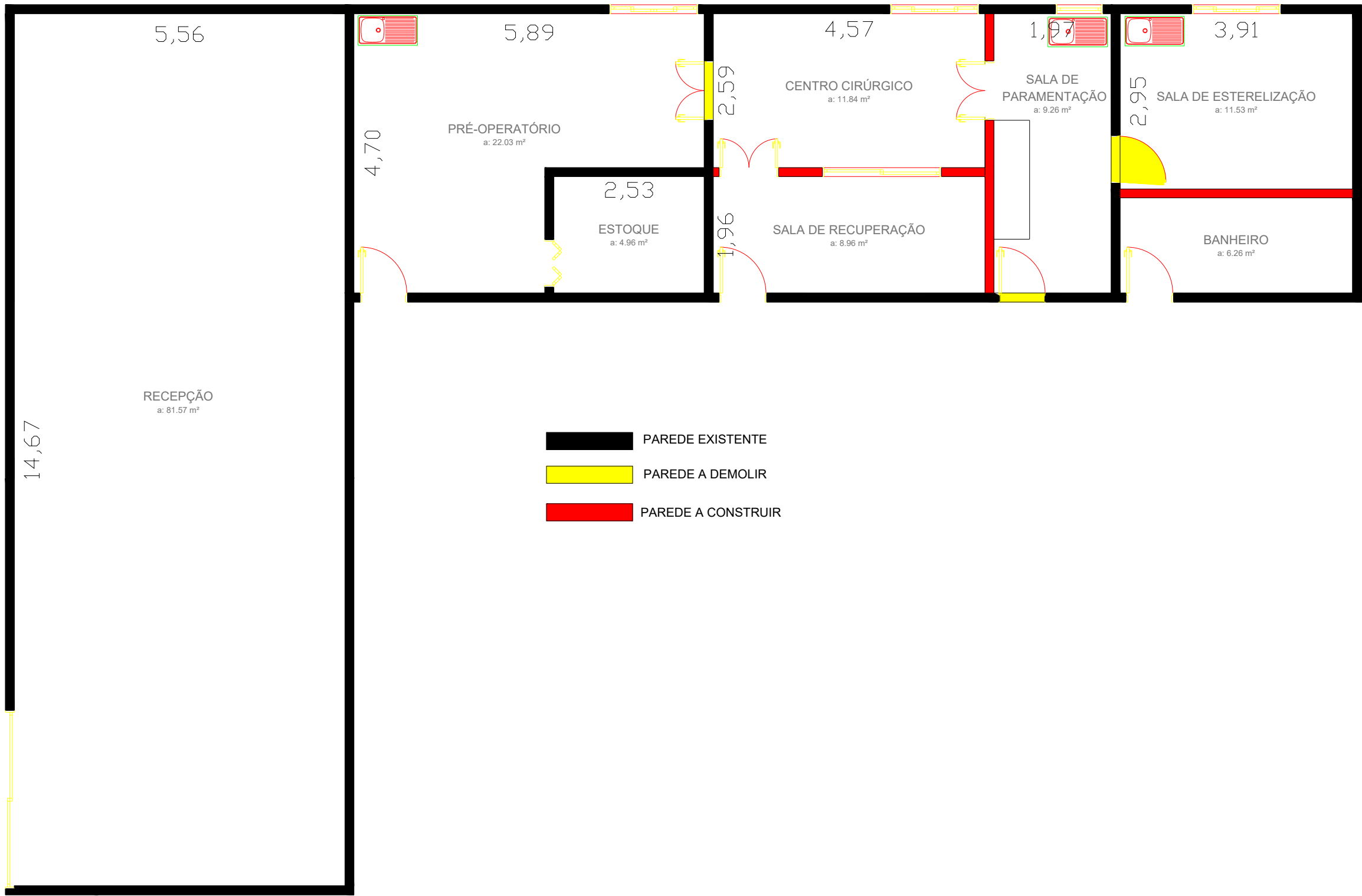
Planta Baixa - Adequações Esc.: 1/100